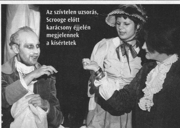
Az előadáson részt vettek a Pécsi Sebestyén Általános Iskola diákjai is